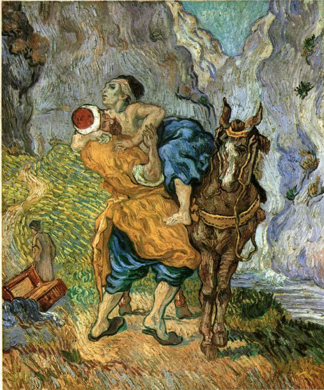
De Barmhartige Samaritaan (naar Delacroix), Vincent van Gogh, mei 1890, Kröller-Müller Museum

‘Ik verzeker jullie: alles wat jullie gedaan hebben voor een van de geringsten van mijn broeders of zusters, dat hebben jullie voor Mij gedaan’ (Mattheüs 25:40)